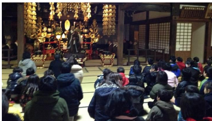
祐天寺本堂にて寒念仏参座中のスカウトたち

なんと1位から3位まで目黒一団のスカウトが独占で「豪華景品！お菓子の袋詰め」を頂きました。