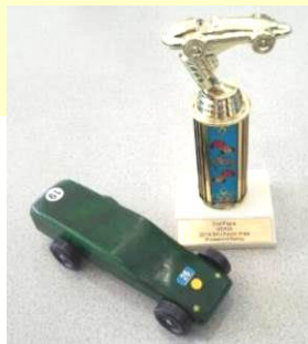
左・入賞のトロフィーを手にする楢館君 おめでとう! ウオー、ウオーウオー 右・トロフィーとレーシングカー