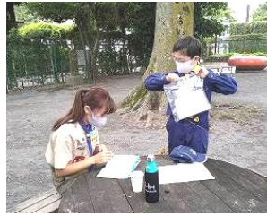
チャレンジシ章も