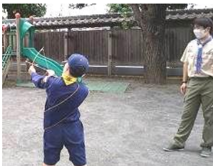
那須と一？ ウイリアムテル？